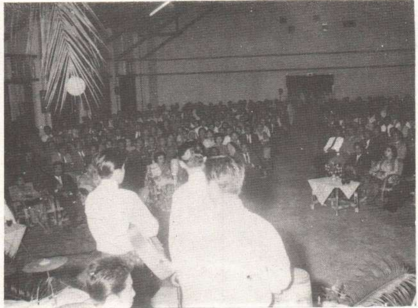
Gambar 5. Suasana malam resepsi pembukaan Perguruan Tinggi Mulawarman (1962)