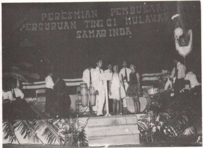
Gambar 6. Salah satu acara hiburan pada malam resepsi pembukaan Perguruan Tinggi Mulawarman (1962)