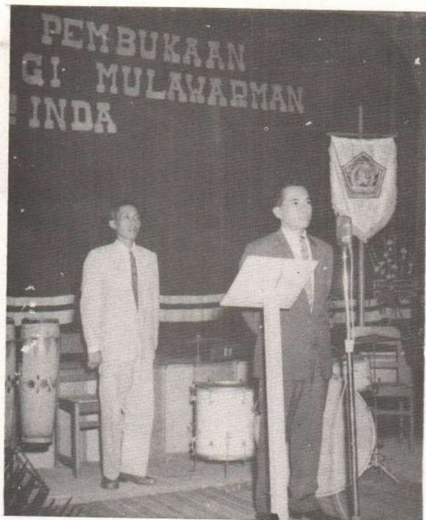
Gambar 3. Sambutan Gubernur Kaltim A.Moeis Hassan pada Pembukaan Perguruan Tinggi Mulawarman (1962)