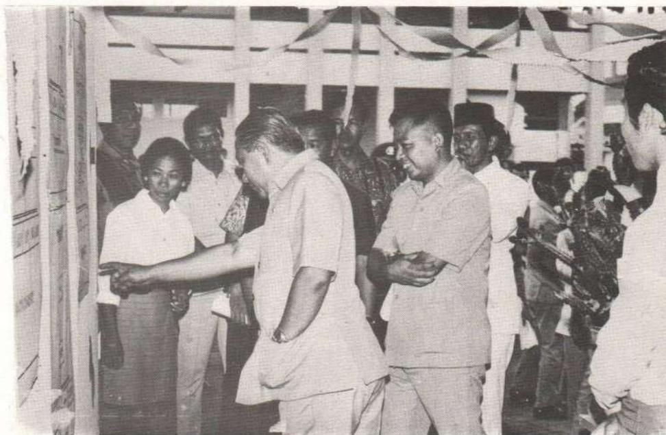
Gambar 10. Peninjauan Menteri Dalam Negeri Amir Machmud pada salah satu Pameran di Jalan P. Flores (1972)