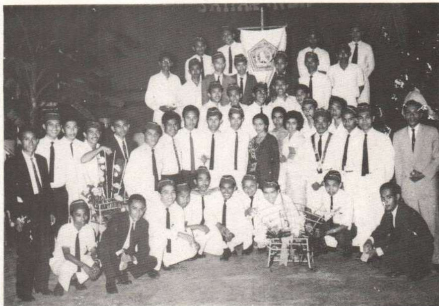
Gambar 9. Panitia Penyelenggara Pembukaan Perguruan Tinggi Mulawarman bersama Mahasiswa (1962)