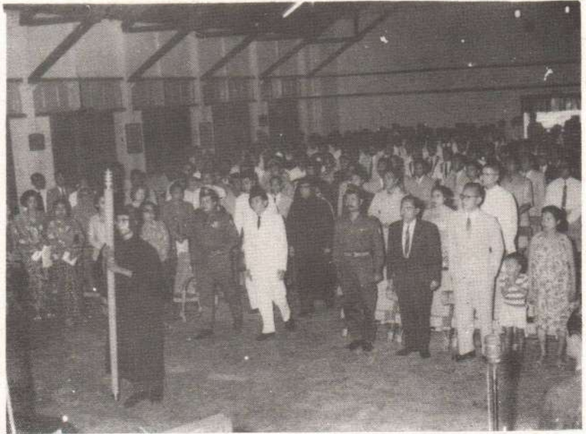
Gambar 1. Suasana Upacara Pembukaan Perguruan Tinggi Mula-warman Gubernur Kaltin dan Pangdam IX Mulawarman Ketua Presidium beserta anggota memasuki ruang Upacara (1962)