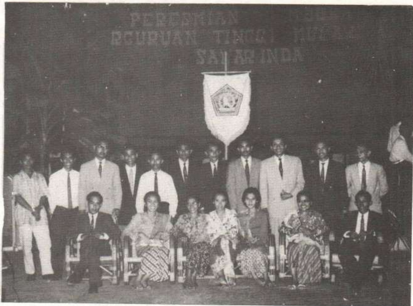
Gambar 8. Panitia Penyelenggara Pembukaan Perguruan Tinggi Mulawarman (1962)