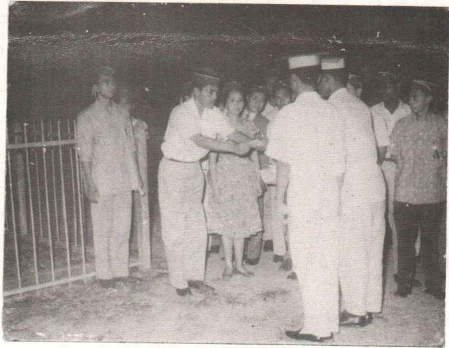
Gambar 7. Malam inaugrasi Mahasiswa Perguruan Tinggi Mula- warman (1962)